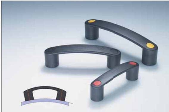
Elastische Bugelgriffe mit unterschiedlichen Abdeckkappen