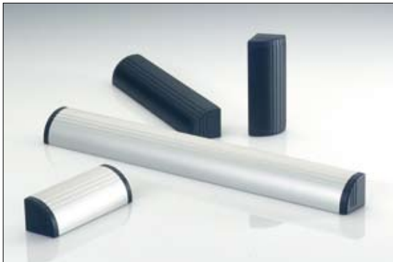
Griffleisten in verschiedenen Ausführungen