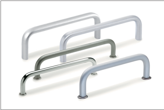
Verschiedene Bügelgriffe für die 19" Technik